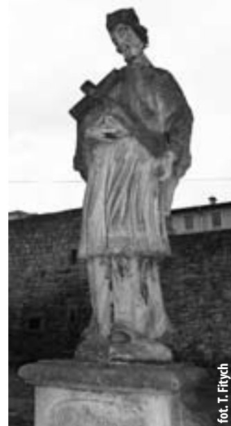
Radków - figura św. Nepomucena

Z wielką radością należy odnotować wyjątkowo pozytywny fenomen kulturowy, nie tylko dla miejscowego środowiska, ale całej ziemi kłodzkiej. Powstał tu szkolny