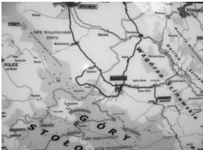
Mapka gminy Radków w pow. kłodzkim

zespół badawczy, z nauczycielem Aleksandrem Mielniczukiem na czele, który postawił sobie ambitny cel. Poprzez inwentaryzację (w aspekcie historyczno-architektonicznym), typologię i syntetyczny opis obiektów małej architektury sakralnej „przyczynić się do lepszego poznania dziedzictwa sakralnego na obszarze, na którym żyjemy”. Młodzieżowy zespół posługiwał się historyczną metodą badawczą. Stanowiło ją pięć podstawowych kategorii: 1) - opis obiektu pod względem typu i konstrukcji architektonicznej; 2) - data powstania; 3) - fundatorzy i wykonawcy; 4) - lokalizacja; 5) - stan zachowania obiektu. Na obszarze parafii, czyli w 5-ciu miejscowościach (z jednym wyjątkiem) zidentyfikowano istnienie aż 72 obiektów. Pod względem liczebności były to kolejno: krzyże - 20, nisze kultowe - 14, kolumny maryjne - 8, figury świętych - 7, mini kalwarie (grupy ukrzyżowania) - 6, kapliczki różnych typów - 6, figury i kolumny św. Jana Nepomucena - 5, kapliczki domkowe - 3.