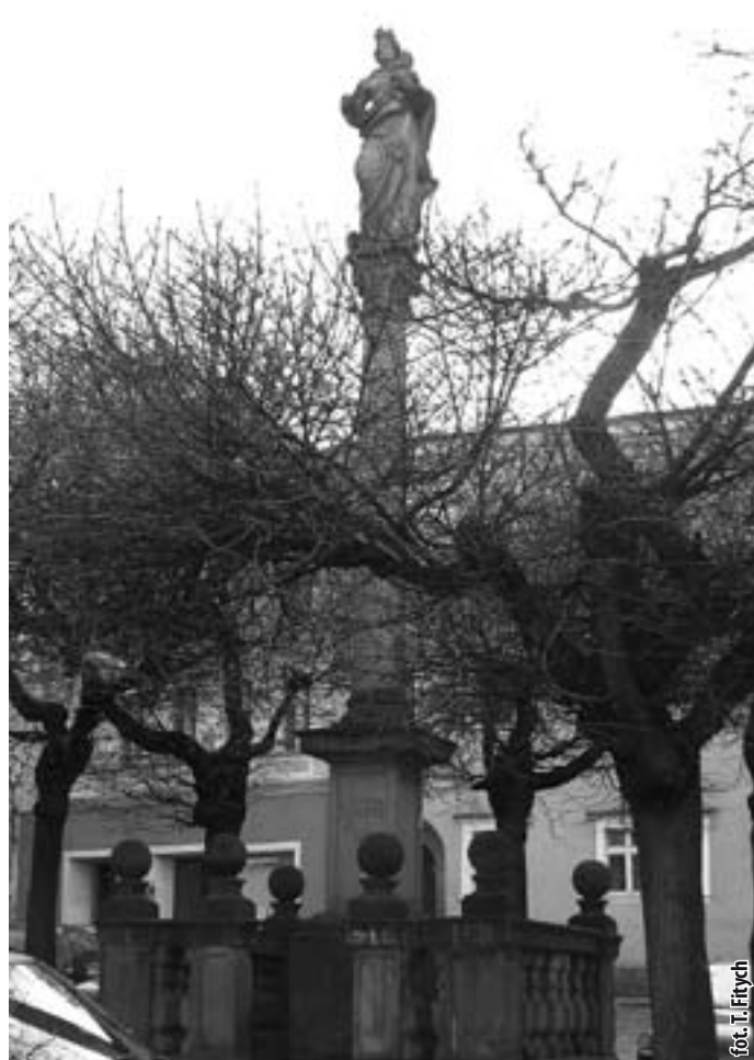
Radków - Kolumna Maryjna z 1680 r.

Dzwonniczki, krzyże i kapliczki przydrożne stanowią wyraz otwartości na sacrum i niezwykle istotny element naszego krajobrazu. Protagoras z Abdery był przekonany, że „człowiek jest miarą wszystkich rzeczy”. Z kolei jeden z najwybitniejszych teologów XX w. ks. prof. Romano Guardini (*1885 +1968), także jako filozof religii głosił opinię, że „tylko ten kto zna Boga zna człowieka”. Warto sobie tę rzeczywistość uświadomić zanim