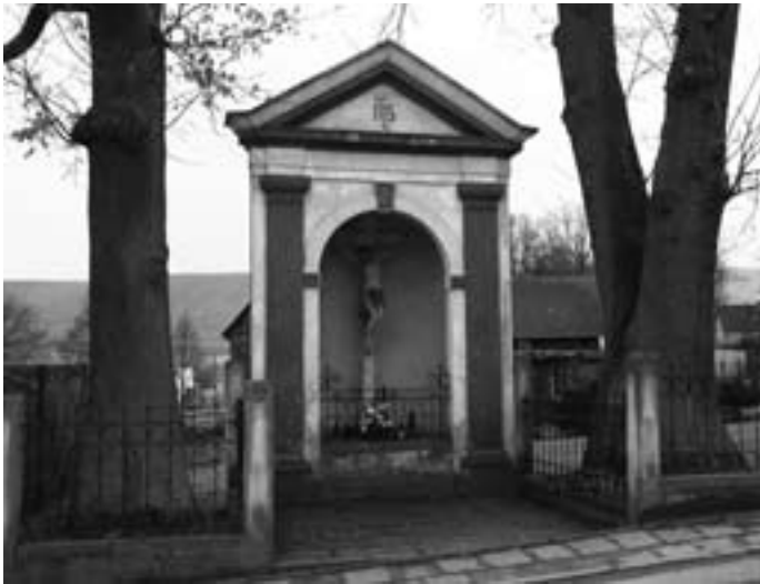
Radków – barokowa kapliczka Męki Pańskiej z XVIII w. i 1910

podejmiemy trud głębszego zrozumienia bogactwa i przesłania sakralnych zabytków naszej miejscowości, miasta, regionu i diecezji. Co więcej, ponieważ nie jesteśmy historykami sztuki, pracownikami wydziału architektury, ani ochrony zabytków, to priorytetem dla nas – ludzi wierzących – będzie nie tyle skupienie się na specyfice i bogactwie form architektonicznych, ale na określeniu sposobów ich wykorzystywania dla zmieniających się form kultu i pobożności, w funkcji dojrzałej osobowej wiary.