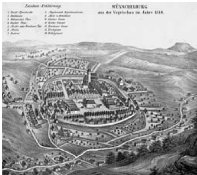
Plan miasta Raków z 1738 r.

W niewielkim tomiku o objętości 60 stron, tenże nauczyciel jest redaktorem i autorem wprowadzenia oraz syntetycznych tekstów o poszczególnych zinventaryzowanych obiektach, jak też wykorzystanych zdjęć archiwalnych. Z kolei projekt okładki, wersję graficzną i skład komputerowy tomiku opracował i sporządził Patryk Sołtys - uczeń Technikum Informatycznego.