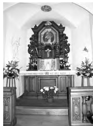
Kaplička PM „Betlém“ v Rokoli - interier