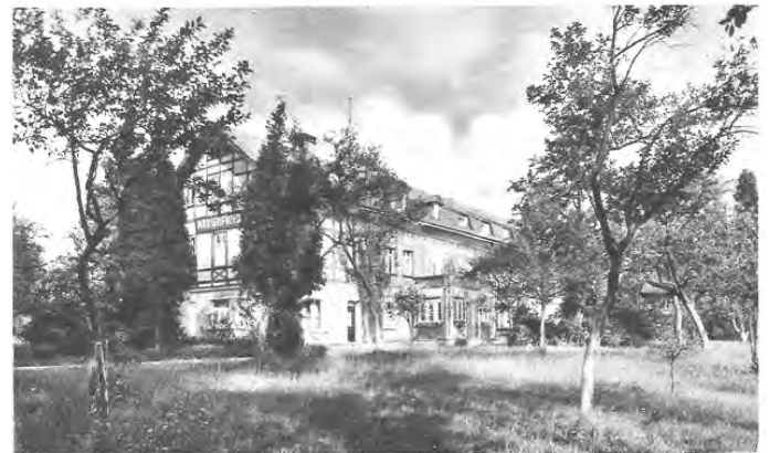
Poutní dům, Rokole.