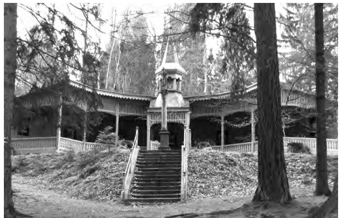
Kaplička u vodního pramene, Rokole.