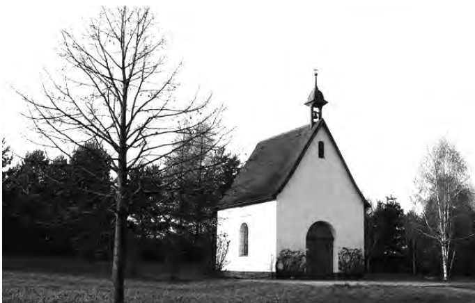
Kaplička PM „Betlém“ v Rokoli