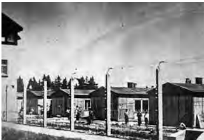
Koncentrační tábor Dachau

262-269; http://www.klodzko.jezuici.pl/ksgrehard.html ; http://jbc.jelenia-gora.pl/Content/3686/hirschfelder.html ; T. Fitych, Zamiast Podsumowania Obrad Sympozjalnych, "Ziemia Kłodzka" (2010) nr 11 (198), s. 10-11.