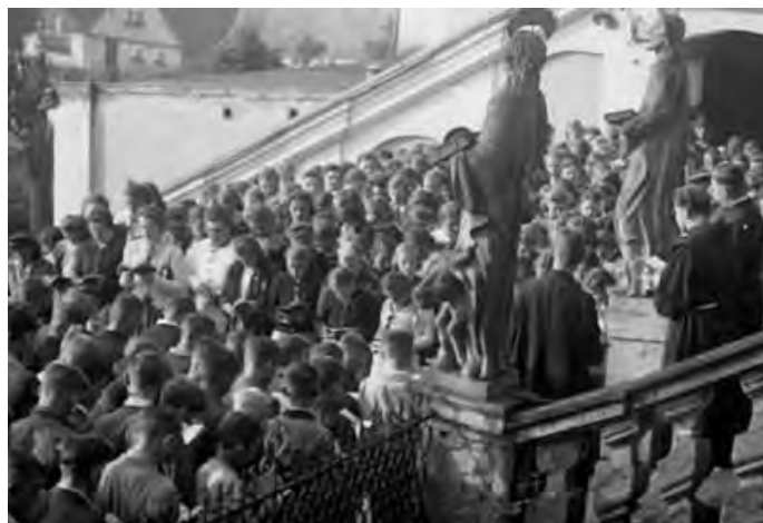
Z pouti před bazilikou Matky Boží ve Vambeřicích