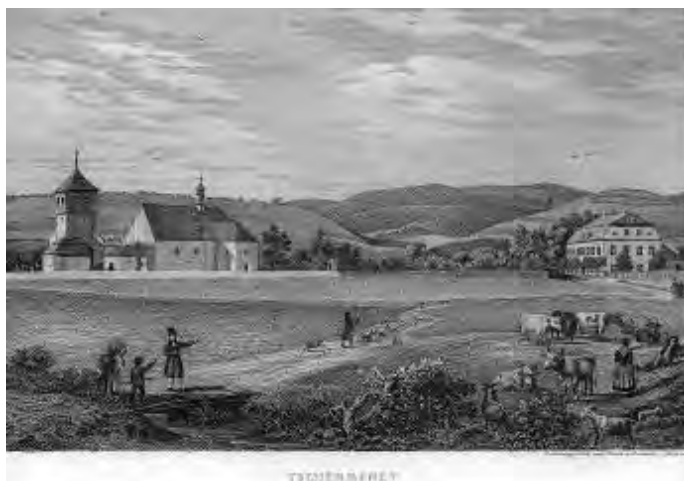
Obce Čermná - mědirytí A. Rossmäslera z roku 1841.