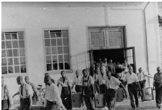
Život v táboře