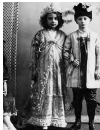
Z dětských představení

Dne 1. února 1932 celebrol novokněz prostým způsobem svou první mši svatou v kapli sester Služebnic Nejsvětějšího Srdce Pána Ježíše v Długopole Zdroji (obec s pěti sty obyvateli se nachází u Bystřice Kłodské, vzdálené 24 km od Kladska). Na primiční obrázek umístil své motto: „Kristus, náš velikonoční beránek, je obětován, Aleluja!“ („Christus, unser Osterlamm, ist geschlachtet, Alleluja“).