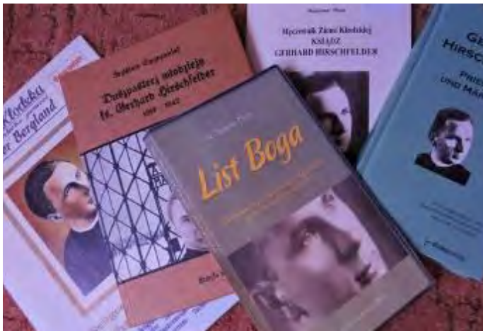
Publikace P. Gerharda Hirschfeldera